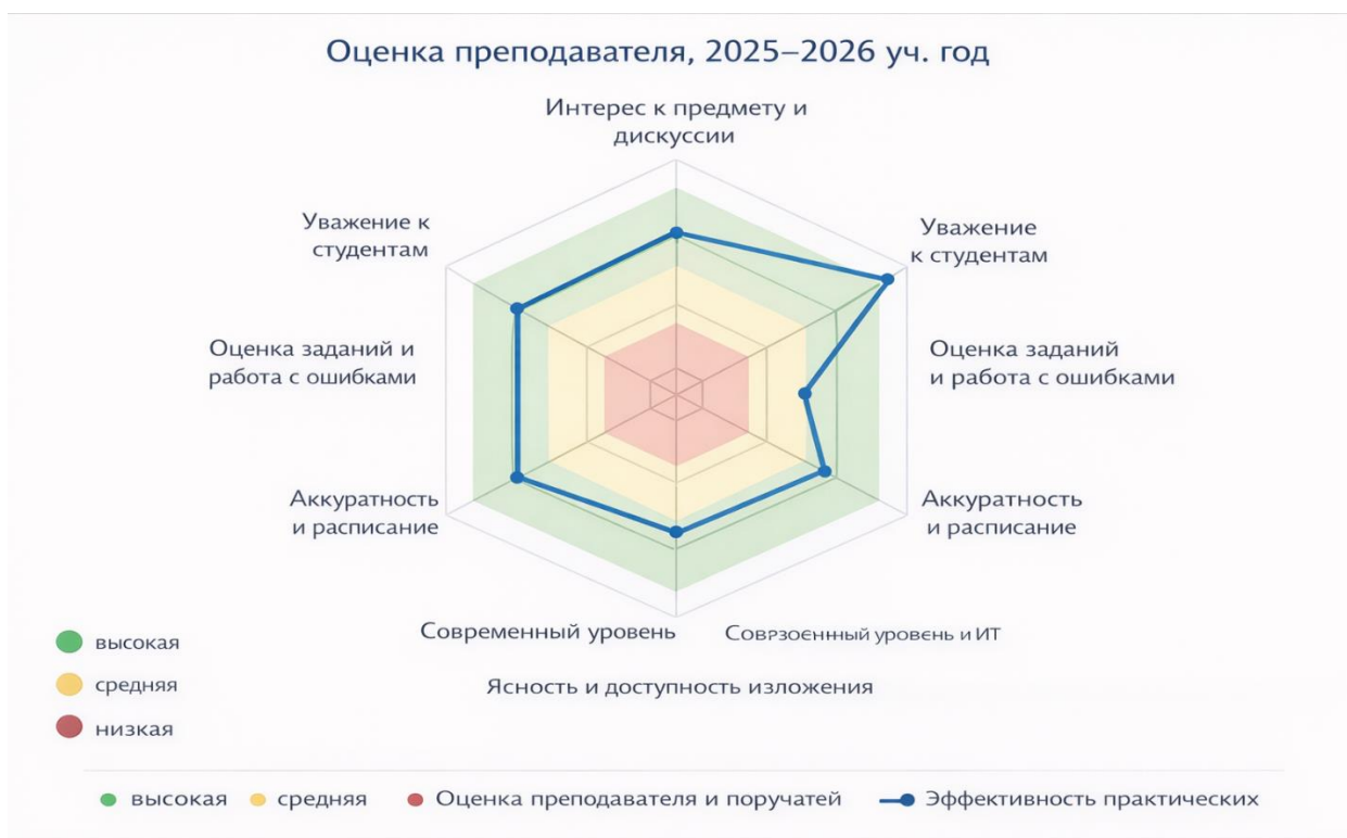
Диаграмма 1. Основные показатели профессиональных компетенций ППС по оценкам по 5-балльной шкале.