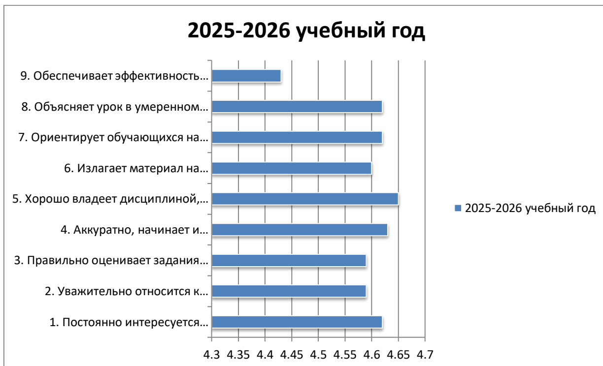
Диаграмма 1. Основные показатели профессиональных компетенций ППС по оценкам по 5-балльной шкале.