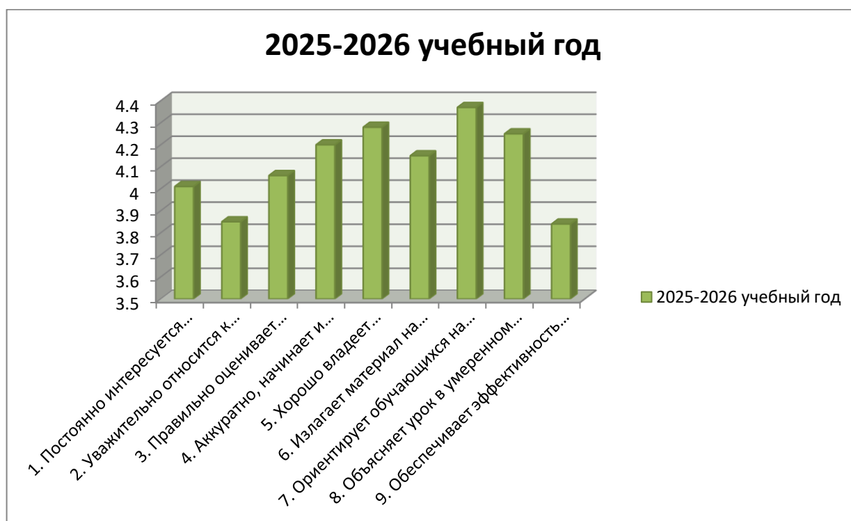
Диаграмма 1. Основные показатели профессиональных компетенций ППС по оценкам рассчитываются по 5-балльной шкале.