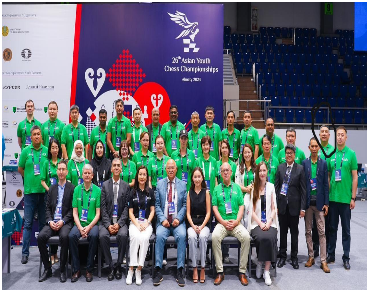
Арбитры Азиатского чемпионата