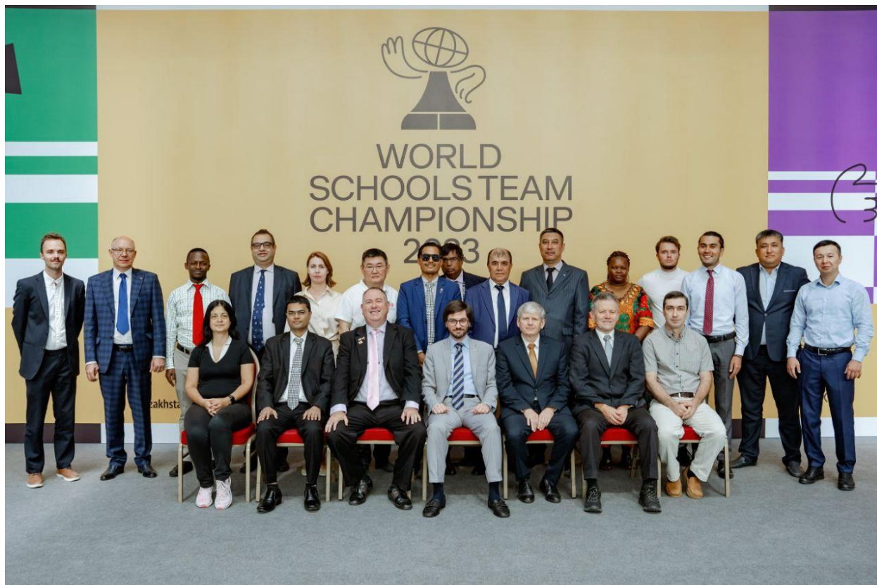
Оргкомитет и бригада арбитров на World Schools Team Championship Рабочий момент турнира