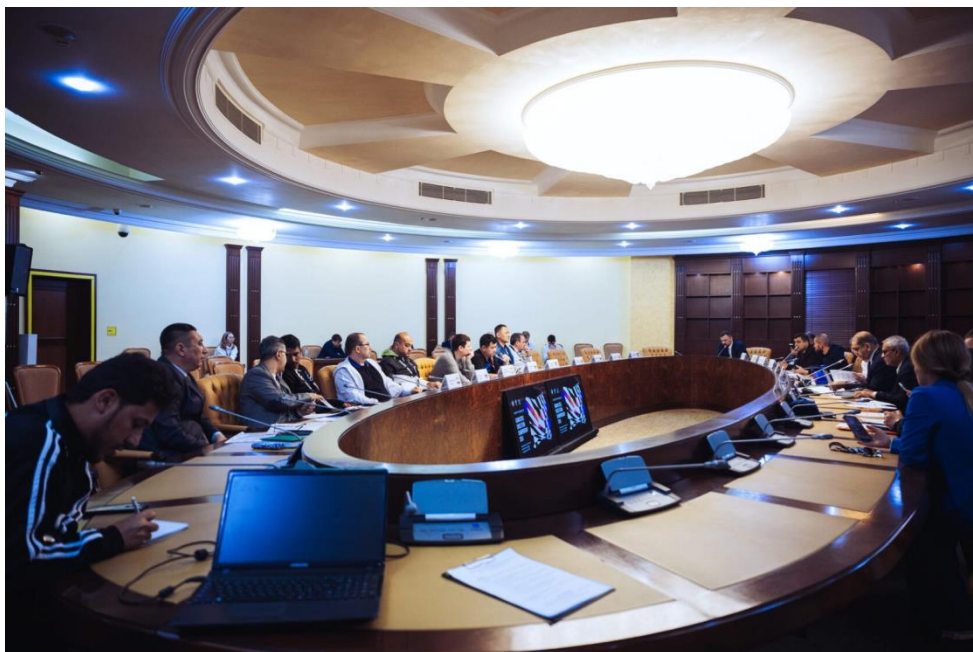
Техническое совещание перед началом турнира